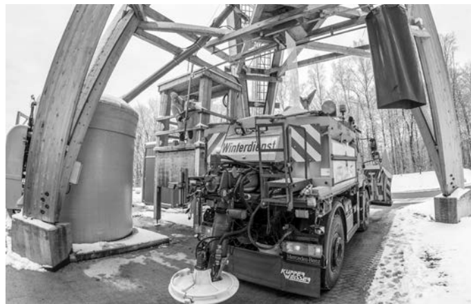
Die Salzlager in den acht Winterdienst-Stützpunkten des Rhein-Neckar-Kreises (unser Bild zeigt das große Silo in Vorderheubach) sind gut gefüllt.

Wieviel der Winterdienst den Rhein-Neckar-Kreis kostet, hängt stark von den Wetterbedingungen ab. „Im vergangenen Winter betragen die Kosten etwa 1,46 Millionen Euro. Die harte Wintersaison 2010/2011 mit viel Schnee und Eis kostete den Landkreis dagegen rund 2,5 Millionen Euro“, verdeutlicht der Leiter des Straßenbauamtes im Rhein-Neckar-Kreis, Matthias Fuchs, die Schwankungen.