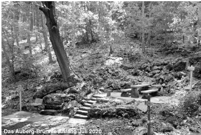
Das Aueberg-Brünnle Anfang Juli 2020

Das Ergebnis kann sich wirklich sehen lassen und lädt ausdrücklich zum entspannten Verweilen ein. Und wenn man seinen Blick über das Felsenmeer schweifen lässt fällt einem ein kleines Plateau auf – hier stand Erzählungen zufolge in früheren Zeiten ein Kohlenmeiler.