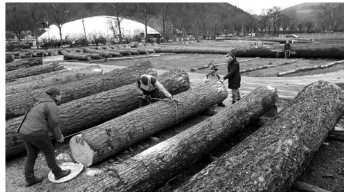
Bei der Vermessung der Stämme arbeiten Verwaltungsangestellte, Waldarbeiter und Förster zusammen.

Für alle Beteiligten - Waldbesitzer, Waldarbeiter und Förster - ist die Submission eine schöne Gelegenheit den Erfolg jahrelanger Waldpflege anschaulich zu präsentieren und Einnahmen für die Pflege der zukünftigen Wälder zu generieren.