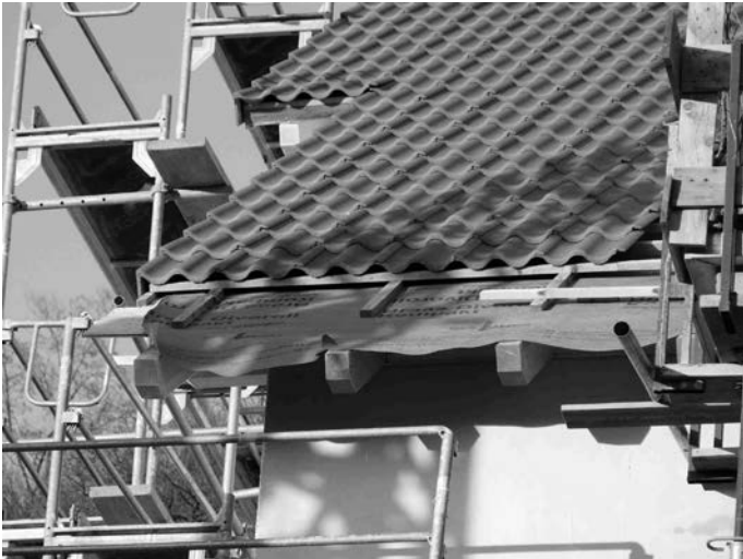
KliBA- Energieberater informieren Sie umfassend über alle Schritte einer energetischen Sanierung und kennen die richtigen Fördertöpfe.